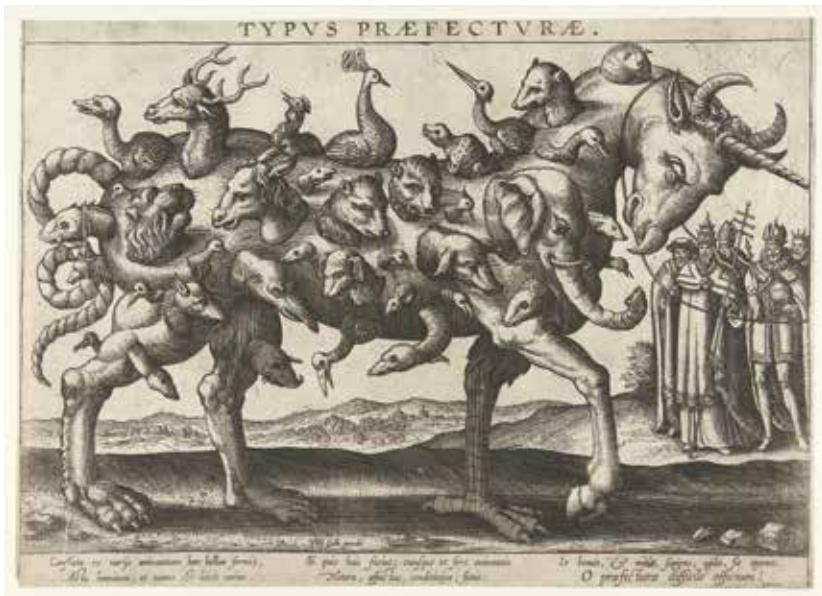
Pieter van der Borch I, Allegorie op de moeilijkheid van het besturen , Typus Praefecturae , 1578, ets op papier, 21 × 29,8 cm, Rijksmuseum Amsterdam

‘Eigenlijk is een creatieproces als dit nooit af: je moet voelen, afwegen, samenvoegen, herinterpreteren, beschouwen...’